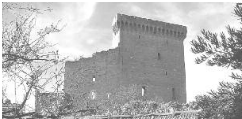
Le Château des Papes

Les trois derniers millésimes à Châteauneuf se distinguent avec les caractéristiques suivantes. Le 2009 est un vin corsé et puissant. Il possède une bonne longueur en bouche avec une belle acidité. C'est un vin de garde, un beau fruit et des tannins fermes. Le 2010 est un vin riche, d'une grande fraîcheur, une belle acidité, avec un fruit incroyable et une belle longueur. On le compare à juste titre au millésime exceptionnel de 2007. Le 2011 est d'une grande fraîcheur avec son beau fruit. Très parfumé, c'est un vin à boire en jeunesse. Charmant, il offre un plaisir immédiat. Dans l'ordre, je conseille de boire en premier les 2011, ensuite les 2010 et après les 2009.