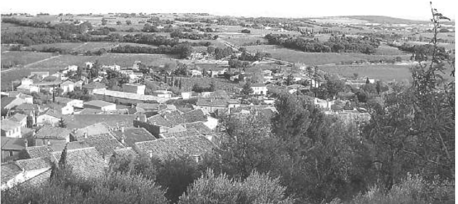
Le village de Châteauneuf

Note : Si vous avez des questions ou des suggestions, vous pouvez les acheminer par courriel à : aervl@videotron.ca , à l'attention de Jean Couvrette.