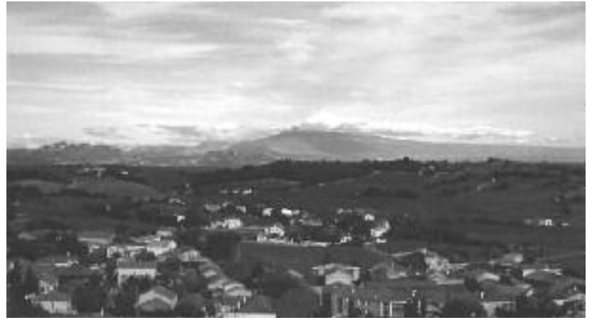
Le Mont Ventoux

Je recommande de toujours carafier un Châteauneuf, une heure avant de le servir à une température de 15 o Celsius. Côté gastronomie, le Châteauneuf se marie bien avec du gibier, une entrecôte sauce aux poivres, un carré d'agneau grillé, ou toute autre grillade.