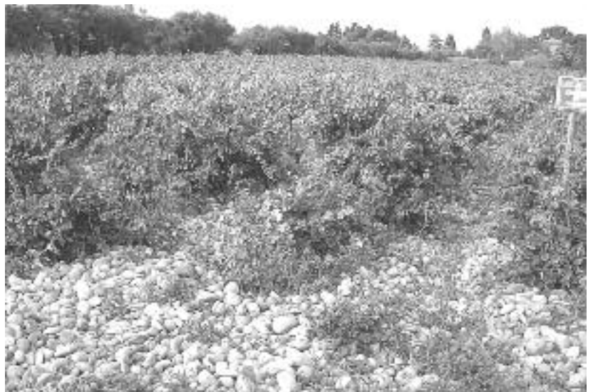
Les galets et la vigne

Appellation d'origine Châteauneuf-du-Pape, dans la région de la Vallée du Rhône. La cuvée réservée est composée de trois cépages; 40 % de grenache, 30 % de syrah et 30 % de mourvèdre. Au nez, des arômes de mûre et de cassis, très complexe en bouche, des tanins agréables avec une finale riche et capiteuse. Potentiel de garde de 10 à 15 ans, le Clos St-Michel est une référence dans le Châteauneuf-du-Pape. À carafier une heure et servir à 15 o Celsius.